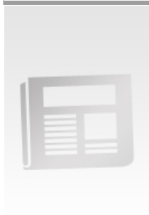
Tableau de bord semestriel - Observatoire économique et social Hautes-Pyrénées

Langue : Français Titre complet : Tableau de bord semestriel Date de création : 1991 Fin de publication : 2007 Périodicité : Semestriel, puis annuel Numéros : N° 1(1991,juin) - n° 27(2007,juil.) Lieu de publication : Tarbes (Hautes-Pyrénées, France) ISSN : 1298-423X Autre forme du titre : Tableau de bord semestriel