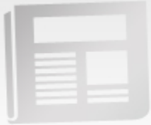
Tableau de bord du Plan de déplacements urbains